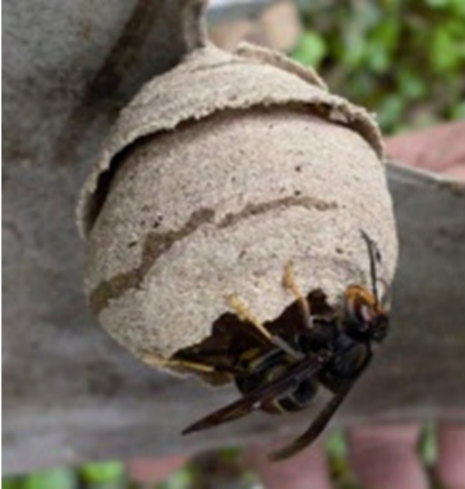
Nid primaire (au maximum de la taille d'un gros melon )